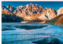
สะพานแขวนฮุสไซนี

** พักที่ Sarai Silk Route Hotel หรือเทียบเท่า **