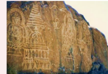
เมืองชิลาส

** พักที่ Shangrila Chilas Hotel หรือเทียบเท่า **