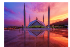
มัสยิดไฟซาล

19.30 น. นำท่านเดินทางสู่สนามบินอิสลามาบัด 23.20 น. ออกเดินทางสู่กรุงเทพ เที่ยวบิน TG350