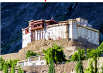
บ่อมบัลดิท