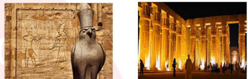
วิหารเอ็ดฟู