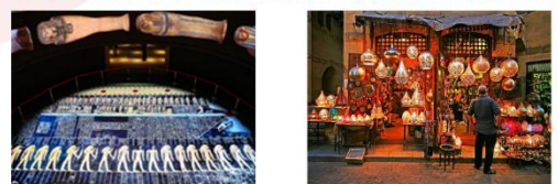
พิพิธภัณฑสถานแห่งชาติอียิปต์