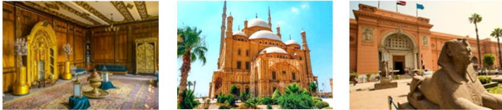
Manial Palace Salah EL Din Citadel & Mohamed Ali Mosque The Egyptian Museum

06.10 น. เดินทางถึงสนามบินอิสตันบูล แวะเปลี่ยนเครื่อง 07.55 น. ออกเดินทางสู่กรุงโคโร ประเทศอียิปต์ เที่ยวบิน TK690 09.20 น. เดินทางถึงสนามบินกรุงโคโร