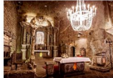
เหมืองเกลือวิลิชกา

** พักที่ Golden Tulip Krakow Hotel 4* หรือเทียบเท่า **