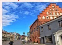
Kaunas Old Town

** พักที่ Holiday Inn Vilnius Hotel 4* หรือเทียบเท่า **