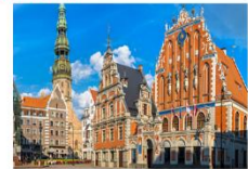
เมืองริกา

** พักที่ Bellevue Park Hotel Riga 4* หรือเทียบเท่า **