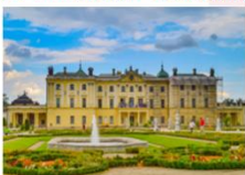
พระราชวัง Branicki