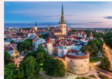
Tallinn Old Town