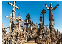
Hill of Crosses