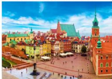
จัตุรัสเมืองเก่า