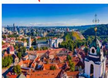
Vilnius Old Town