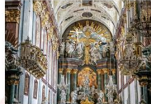
อารามจัสนา โกรธา

** พักที่ Mercure Centrum Hotel 4* หรือเทียบเท่า **