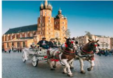
Krakow Old Town

05.15 น. เดินทางถึงสนามบินอิสตันบูล และเปลี่ยนเครื่อง 07.25 น. ออกเดินทางสู่สนามบินคราคูฟ เที่ยวบิน TK1271 08.45 น. เดินทางถึงสนามบินคราคูฟ ประเทศโปแลนด์