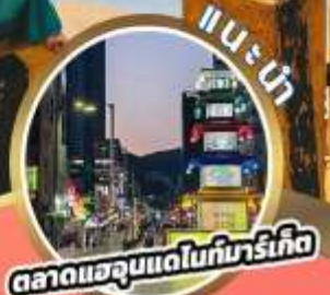
ตลาดแฮจูมแดไนท์มาร์เก็ต