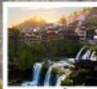
ฟูฟงจิ้น