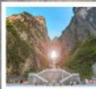
เจาเทียนเหมินซาน

เจาหม่างซาน / แกรนด์แคนยอนหม่าหวงฮว / เมืองโบราณฟังหวง / ส่องเรือตามลำน้ำตัวเรียงชมเมืองโบราณฟังหวงยามค่ำกับสะพานสายรุ้ง / น้ำตกฟูฟงจิ้น / กาพวดทราย / เจาเทียนเหมินซาน / ระเบิดยิงแก้ว / ประตูสวรรค์ / ถนนคนเดินฉางเต๋อ