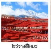
โซ่วจางอีหมว