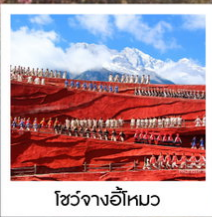
โซ่วจางอีไห่