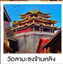
วัดลามะชงจ่านหลิง