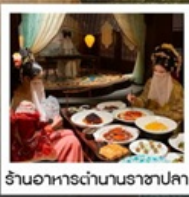
ร้านอาหารตำนานราชาปลา