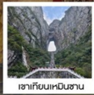
เขาศึกษาเหมินซาน

พิเศษ!!...รอบค่ำเช้าชุดพื้นเมืองที่ฟ่งหวง • รอบค่ำช่างถ่ายรูป น้ำตกฟูหรง