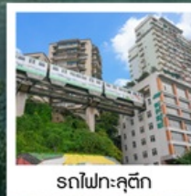
รถไฟฟ้าทุติย

มหาศาลาประชาชน / รถไฟฟ้าทุติย ถนนคนเดินเจียงฟางเป่ย์ / ล่องเรือสำราญ CENTURY VICTORY CRUISE ล่องเรือแม่น้ำแยงซีเกียง / โชว์สามก๊ก / ช่องแคบอูเลีย ช่องแคบชวี่กิงเสีย / นั่งเรือเล็กชมเส้นหนึ่งซี / งานเลี้ยงอำลาจากทางเรือ นั่งลิฟท์ข้ามเขื่อนซานเสี่ยต้าป้า / Three Gorges Project Museum