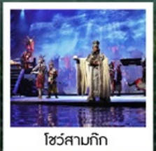
โชว์สามก๊ก