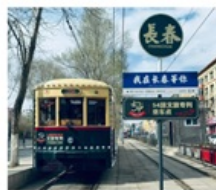
นั้งรรางดางซุน