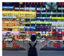
กำแพงมหาวิทยาลัยเหยียนเปียน