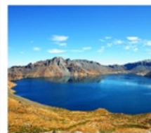
ดางไป่ซาน