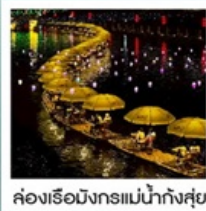
ล่องเรือมังกรแม่น้ำก้งซุย