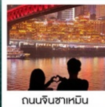
ถนนจินซาเหมิน