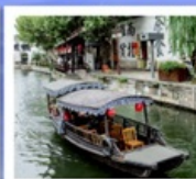
เมืองโบราณหนานสวิน