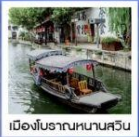
3 ตึกใหญ่แห่งเมืองเซี่ยงไฮ้ | เซี่ยงไฮ้ คลาสสิก ไทท์ | เมืองโบราณหนานสวิน