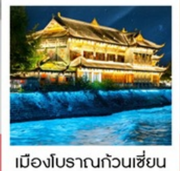
เมืองโบราณก่วนเซียน