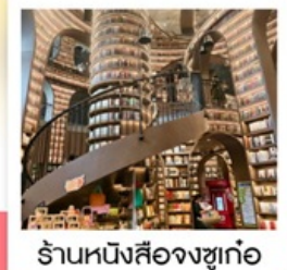
ร้านหนังสือจงซูก่อ

ศูนย์อนุรักษ์หมีแพนด้าตู่เจียงเยียน (รวมรถแบดเตอร์) / ร้านหนังสือจงซูก่อ / จตุรัสหย่างเทียนวู / รูปปั้นหมีแพนด้าเซลฟี / เมืองโบราณก่วนเซียน ที่ทำการไปรษณีย์หมีแพนด้า (PANDA POST) / ถนนคนเดินซุนซีลู่ / ห้าง IFS แพนด้าปิ่นติก / Chengdu Eastern Memory / ถนนคนเดินไท่กู่หลี่ / ห้าง SKP