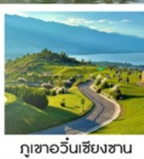
กุ้อเซียนเซียงซาน