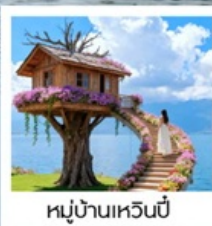
หมู่บ้านหวนปี้

เมืองโบราณต้าหลี่ / นั่งเรือสู่เกาะเสี้ยวผู่ / ซานโตรินี่ (รวมรถแบบเตอร์) / ถนนทางแอร์ต้าต้า / กุ้อเซียนเซียงซาน / ต้าซ่าท่าเรือหลงกัน โค้ง S ทะเลสาบเอ้อไห้ / หมู่บ้านโบราณสี่จิว / หมู่บ้านหวนปี้ / ชมดอกไม้ตามฤดูกาล