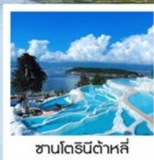
ซานโตรินี่ต้าหลี่

“เกาะเสี้ยวผู่...เกาะลึกลับกลางทะเลสาบ เอ้อไห้”