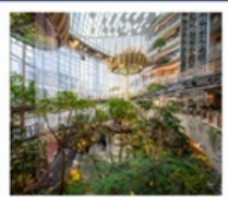
THE RING MALL