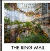
THE RING MALL