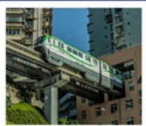
นั่งรถไฟทะลุติ๊ก