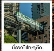
NINGBO ไฟทะลุติ๊ก