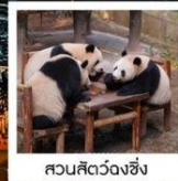
สวนสัตว์จงชิ่ง