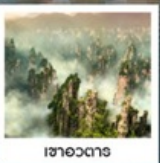
เซาอวตาร