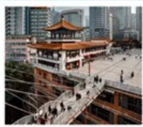
ตึก 22 ชั้น