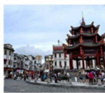
เมืองเก๋าฮ่าวเถา