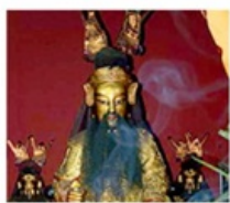
เอียงบู๊ซิว