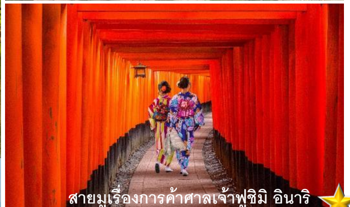
สายมูเรื่องการค้าศาลเจ้าฟูชิมิ อินาริ