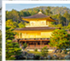
กิงกะกุจิ