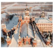
คฤหาสน์วอลการ์