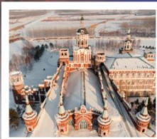
อุทยานหิมะ