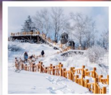
ภูเขาหิมะ