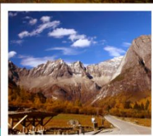
กุหลาบสีดรุณี