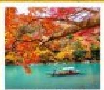
ฮารุชิมางะ