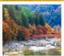
หุมาซังโงะ

ฮารุชิมางะ / โยนงะ / ฮอนทามะฮะ / ฮอนฟูจิ / ฮอนมัตสึ / ฮอนทามะฮะ / โยนงะ / หุมาซังโงะ / ฟูจิซัง / โยนงะ / ฮอนทามะฮะ / ฮอนฟูจิ / ฮอนมัตสึ / ฮอนทามะฮะ / โยนงะ / หุมาซังโงะ