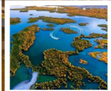
ทะเลสาบอูลุนกู๋

ผ่านทางด่วนทะเลทราย S21 / ทะเลสาบอูลุนกู๋ / ปู่อ๋อจิน / เซาโปซซา / ทุ่งหญ้าอาเหอถังโก่ตี้ / หมู่บ้านเหมอู่ซุน / คานาสีอ / ทะเลสาบมังกรหลับ / ทะเลสาบแควตาด จุดชมวิวกานาสีอ / ศาลาชมปลา / ค่องเรือทะเลสาบคานาสีอ / หาดห้าสี / เมืองปีศาจ / เมืองคาลามาอี / คาลามาอี / แกรนด์แคนยอนตูซันจือ / ตลาดต้าปาจาง