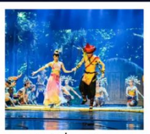
โชว์เซียนกู่จิง