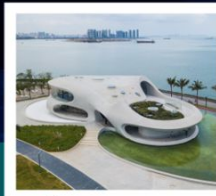
ห้องสมุดหยุนตง