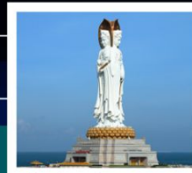
เจ้าแม่กวนอิมหนานซาน