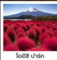
โออิชิ ปาร์ค