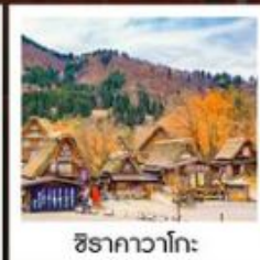
ชิราคาวาโกะ