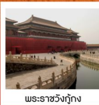
พระราชวังกู่กง