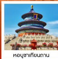
หอบูชาเทียนถาน