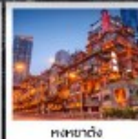
ต๋าชางถัว