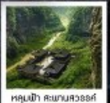
หลุมฟ้า ต๋าชางถวอถวอ