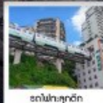
ต๋าโหลต๋าจู้

ทัวร์คุณธรรม ไปลงร้านซอปปิง • ไปชายออฟชั่น