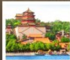
อวี่เหอหยวน