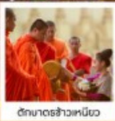
วัดมหาธาตุเวียง