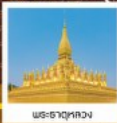
พระธาตุหลวง