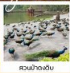
สวนน้ำดงดิบ