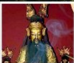
เอียงบู๊ซิว