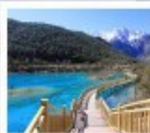
โป๋ซู่เหอ