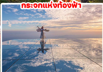
กระบอกแห่งท้องฟ้า