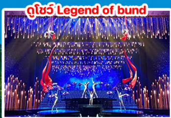
ดูโชว์ Legend of bund