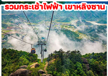
รวมกระเช้าไฟฟ้า เขาหลินซาน