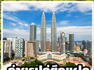
ถ่ายรูปคู่ตึกแฝด