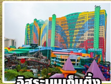
อิสระบนเก็นติ้ง