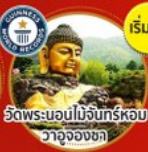
วัดพระนอนไม้จันทร์หอม วาจุงงซา