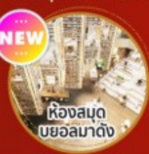
ห้องสมุด บยอลมาดัง