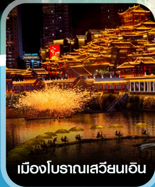
เมืองโบราณเสวียนเอน