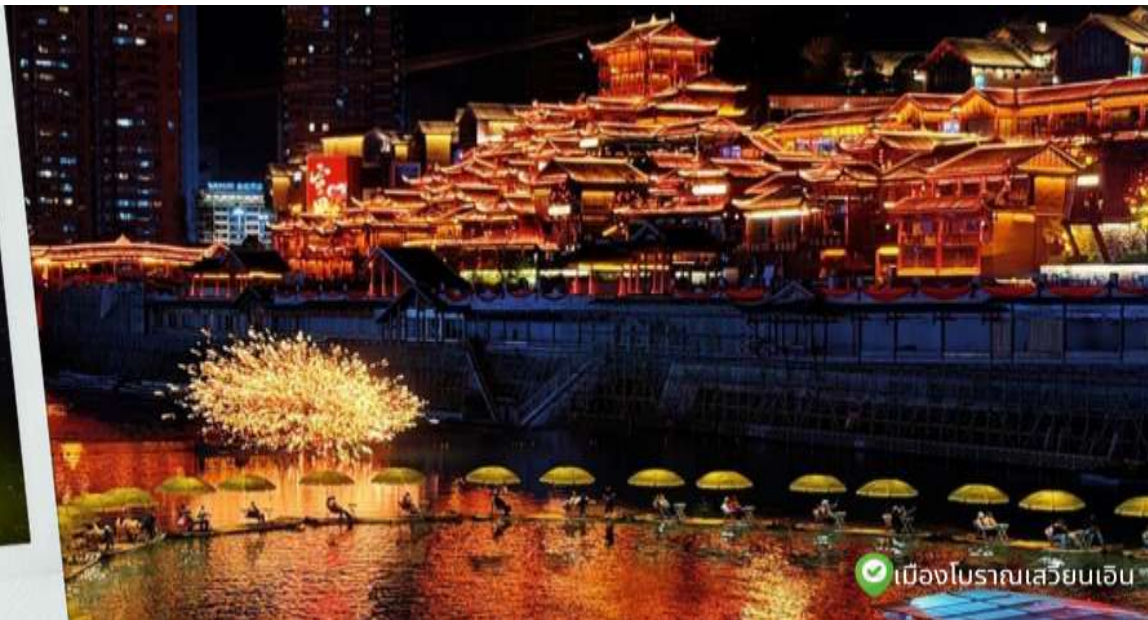
เมืองโบราณเสวียนเอิน