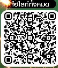
ทั่วโลกทั้งหมด