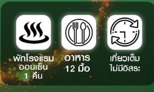
พักรีสอร์ท ออนเซ็น 1 คืน อาหาร 12 มื้อ เที่ยวเต็ม ไม่มีอิสระ