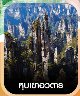
หุบเขาอวตาร

คอนเฟิร์ม ออกเดินทาง ทุกพีเรียด 2 ท่านขึ้นไป