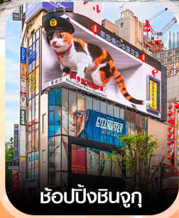
ซ้อปิ้งชินจูกุ