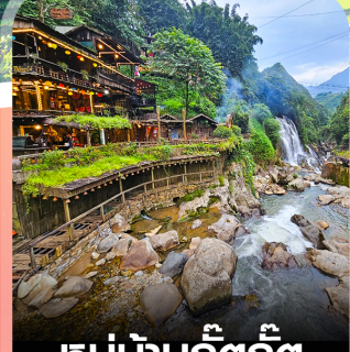
หมู่บ้านก๊วกก๊วก