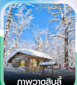
ภาพวาดสีบลู