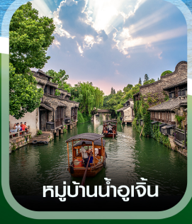
หมู่บ้านน้ำอูเจิน