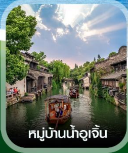
หมู่บ้านน้ำอู๋เจิน

คอนเฟิร์มออกเดินทาง ทุกพีเรียด 2 ท่านขึ้นไป