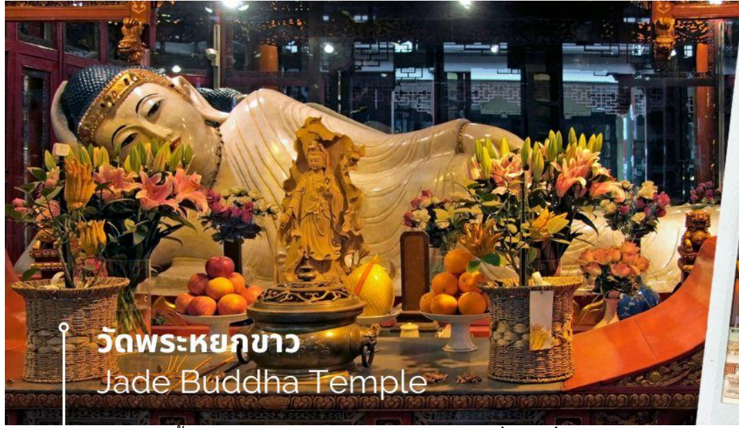
วัดพระหยกขาว Jade Buddha Temple

นำท่านเลือกชมและเลือกซื้อสินค้าร้านผ้าไหม ก่อนจะนำท่านชม วัดพระหยกขาว Jade Buddha Temple เป็นวัดที่มีชื่อเสียงมากที่สุดในเมืองเซี่ยงไฮ้ ซึ่งเป็นที่รู้จักจากพระพุทธรูปสององค์ที่สร้างขึ้นจากหยกทั้งแท่ง องค์พระพุทธรูปปางนั่งมีความสูง 190 เซนติเมตร และ หุ้มด้วยเพชรพลอย หิน มโนรา และ มรกต และองค์พระพุทธรูปปางไสยาสน์ มีความยาว 96 เซนติเมตร นอนเอียงด้านขวาและหนุนพระเศียรด้วยพระหัตถ์ขวา ถือเป็นวัดที่มีทั้งชาวจีนและนักท่องเที่ยวเดินทางมาสักการะบูชาตลอดทั้งวัน