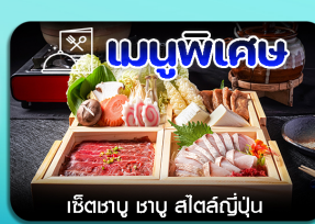
เชิซเตาซู ซาซู สีสต์ญี่ปุ่น