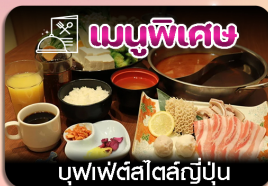
บุฟเฟ่ต์สไตล์ญี่ปุ่น

ซัปโปโร-ชมทุ่งดอกลาเวนเดอร์-โทมิตะฟาร์ม-ชิชิไซโนะโอกะ-น้ำตกชิราอิเกะ-บ่อน้ำสีฟ้า-อีสระะซ็อบบั้งเต็มวัน-ฟักออนเซน