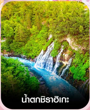
น้ำตกชิราอิเกะ