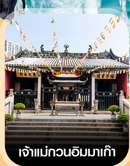
เจ้าแม่กวนอิมมาเก๊า

✈️ คอนเฟิร์มออกเดินทาง ✈️ ทุกพีเรียด 2 ท่านขึ้นไป