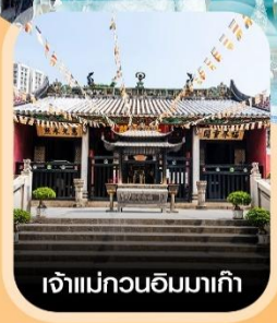
เจ้าแม่กวนอิมมาเก๊า