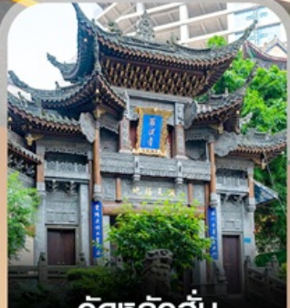
วัดหลิวอัน