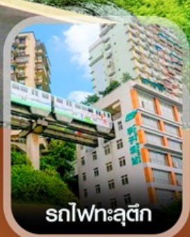
รถไฟทะเลตุ๊ก

✈️ คอนเฟิร์มออกเดินทาง ทุกพีเรียด 2 ท่านขึ้นไป