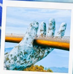
บาน่าฮิลล์