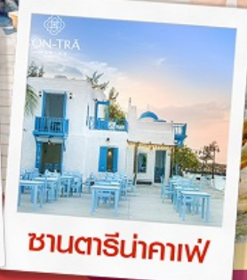
ซานตารีนาคาเฟ่