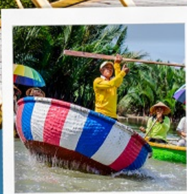
เรือกระดิง