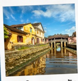
เมืองโบราณฮอยอัน