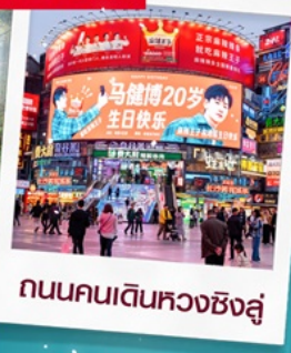
ถนนคนเดินหวงซิงสู