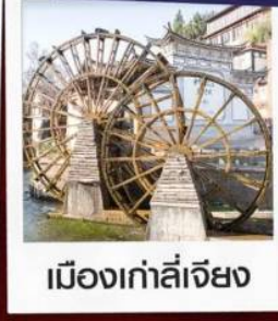
เมืองเก้าลี่เจียง