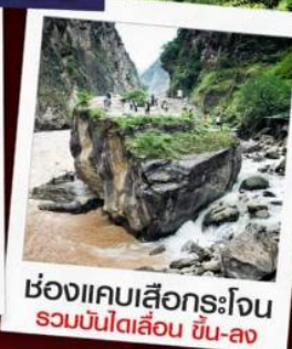
ช่องแคบเสือกระโจน รวมบันไดเลื่อน ขึ้น-ลง