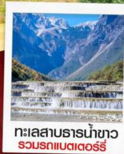
ทะเลสาบธารน้ำขาว รวมรถแวนเตอร์รี่